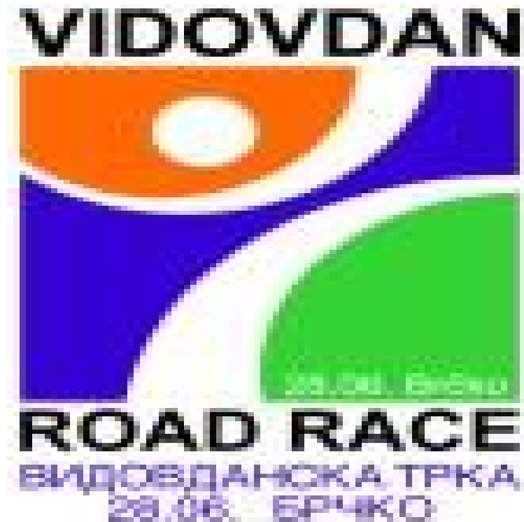
Zvanični logo Vidovdanske trke

Želja mi je da u ovom seminarском radu predstavim jednu masovnu atletsку sportsku manifestaciju koja se svake godine 28. juna održava u Bosni i Hercegovini u gradu Brčko, a koja se zove Vidovdanska trka ili Vidovdan Road Race, (atletska trka na 10 km na cesti) pozitivne implikacije koje ona stvara prema gradu, njegovoj promociji, prema građanima i prema procesu pomirenja u BiH i posebno implikacije sa stanovišta posleratne resocijalizacije mladih kroz sport u sredini koja je bila devastirana međunacionalnim sukobom, a koja je, daleko brže od drugih sličnih destinacija doživjela oporavak.